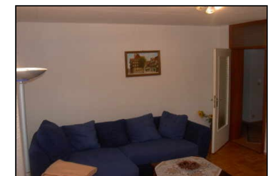
Wohn-/Schlafzimmer (60 m 2 )