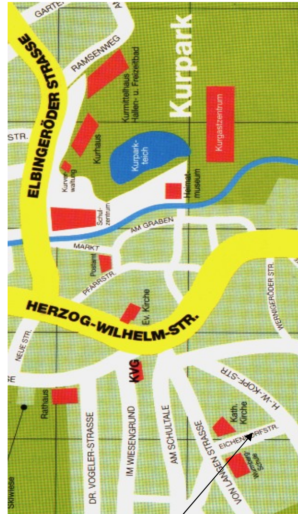
Lage der Wohnungen