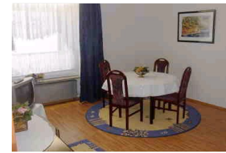
Essbereich (42 m 2 )