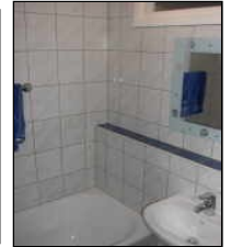
Bad (60 m 2 )