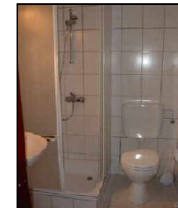
Bad (42 m 2 )