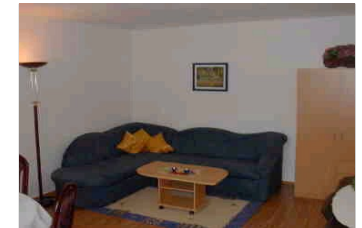
Wohn-/Schlafzimmer (42 m 2 )