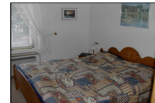
Schlafzimmer (60 und 42 m 2 )