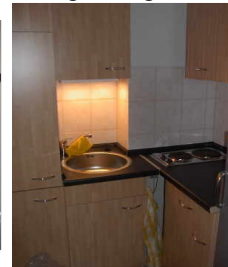
Küchen (60 und 42 m 2 )